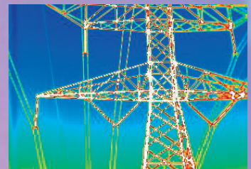
Transporte y distribución eléctrica